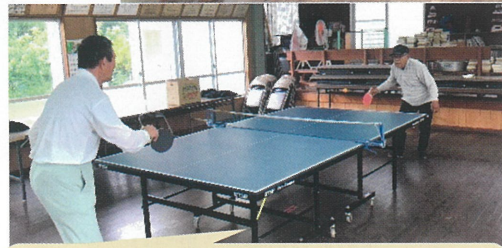
津波区、眠っていた卓球台を出してみたら、楽しい居場所になっています♪